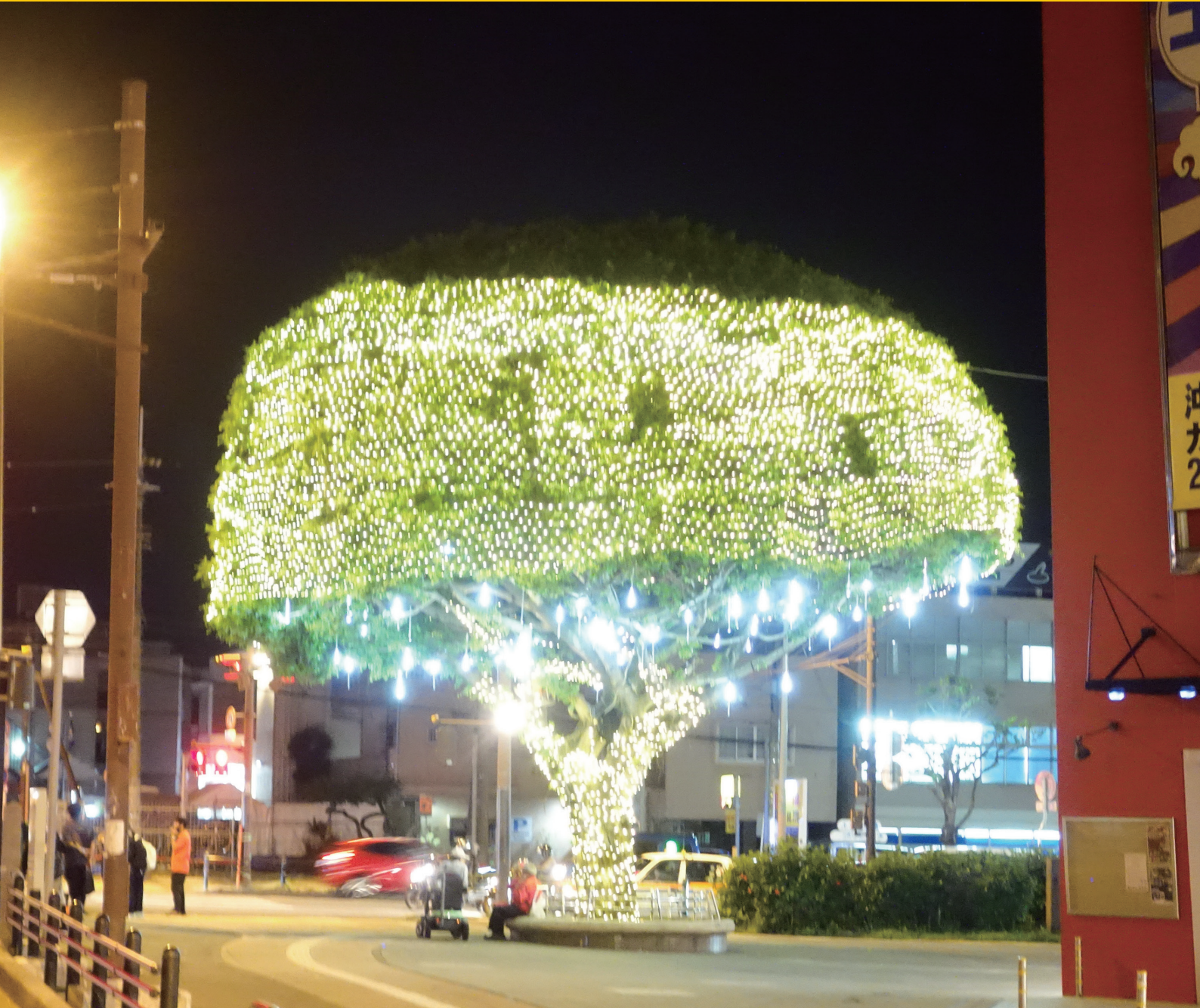
ミュージックタウン音市場前交差点