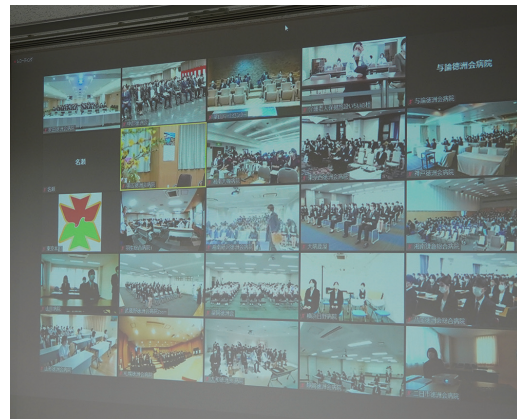
全国の施設にライブ配信