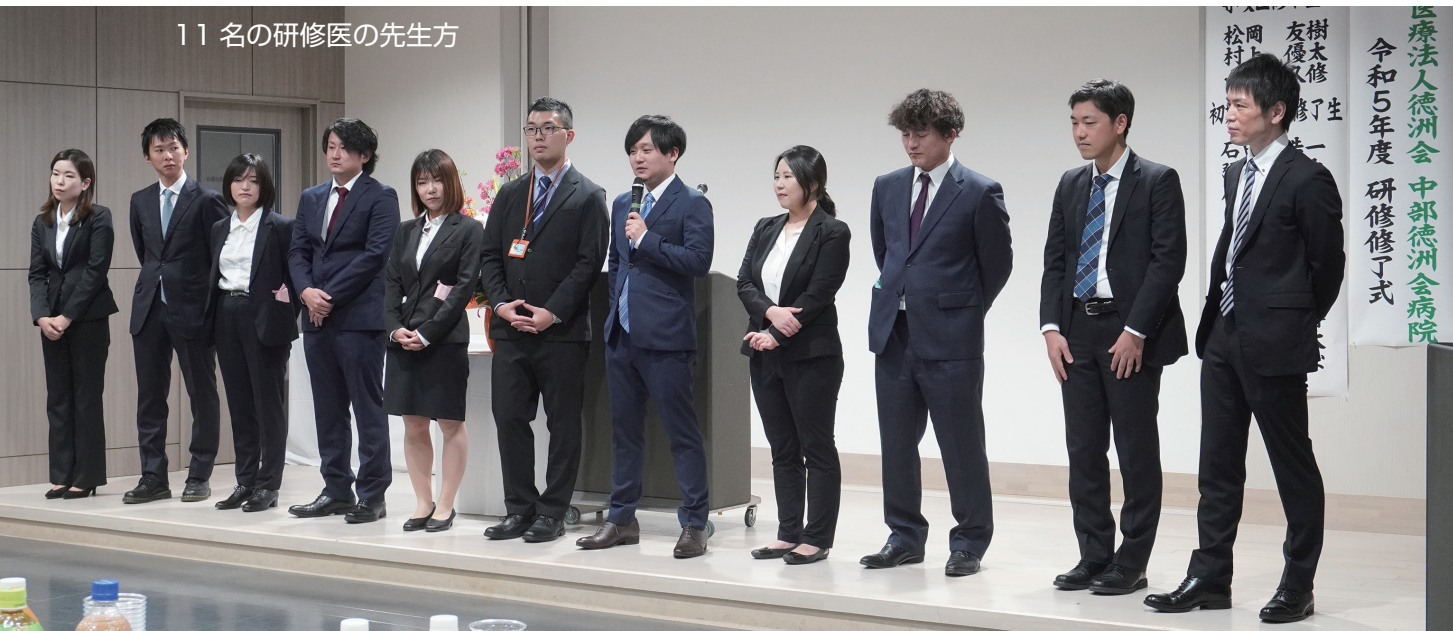
11名の研修医の先生方

期待していること、これからの人生、医師として活躍して欲しいと、感謝の言葉が贈られました。