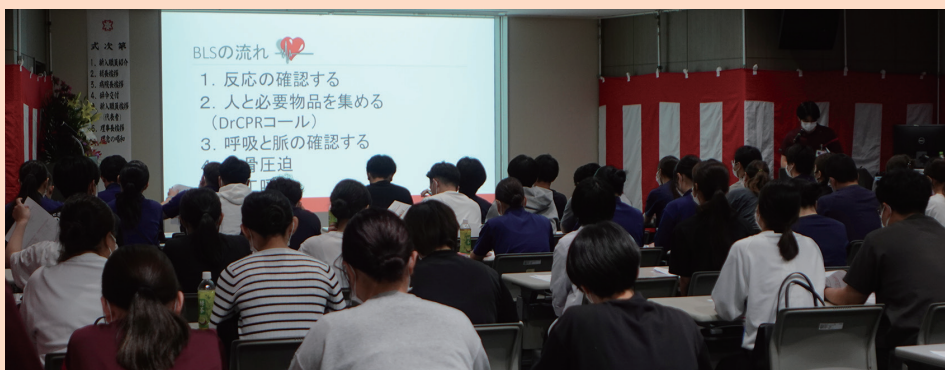
新入職員 オリエンテーションの様様

配信し徳洲会の職員としての心構えなどを送りました。東上理事長は、徳洲会の歴史や「生命だけは平等だ」の理念について説明、「24時間365日患者さんに対応するのが徳洲会の精神」と強調しました。 新入職員皆さんの新たな一歩の始まりを心からお祝い申し上げます。これからの日々が、皆様にとって充実したものであり、成長と成功に満ちたものであることを心から願っています。