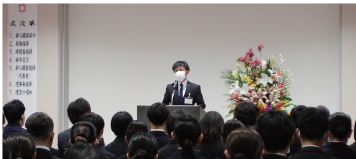
新入職員代表挨拶