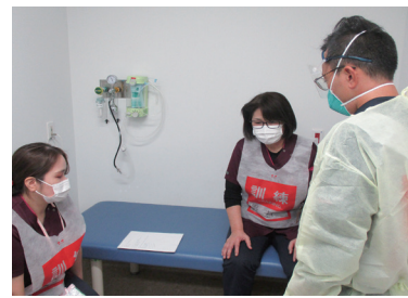
感染の疑いのある患者さんに対応する医師