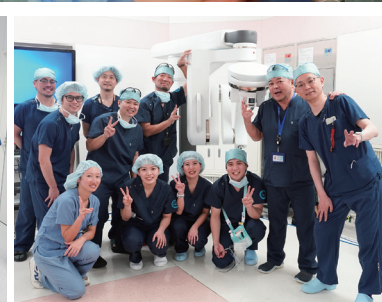
看護師・プロクター医師