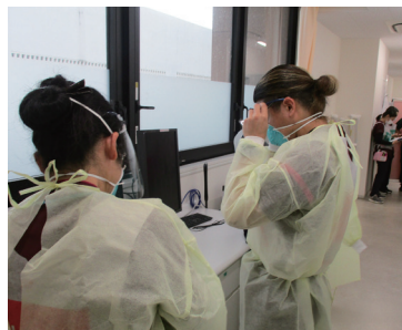
防護服に着替えた看護師