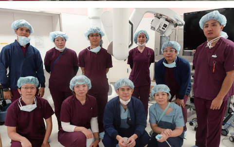
看護師・臨床工学部