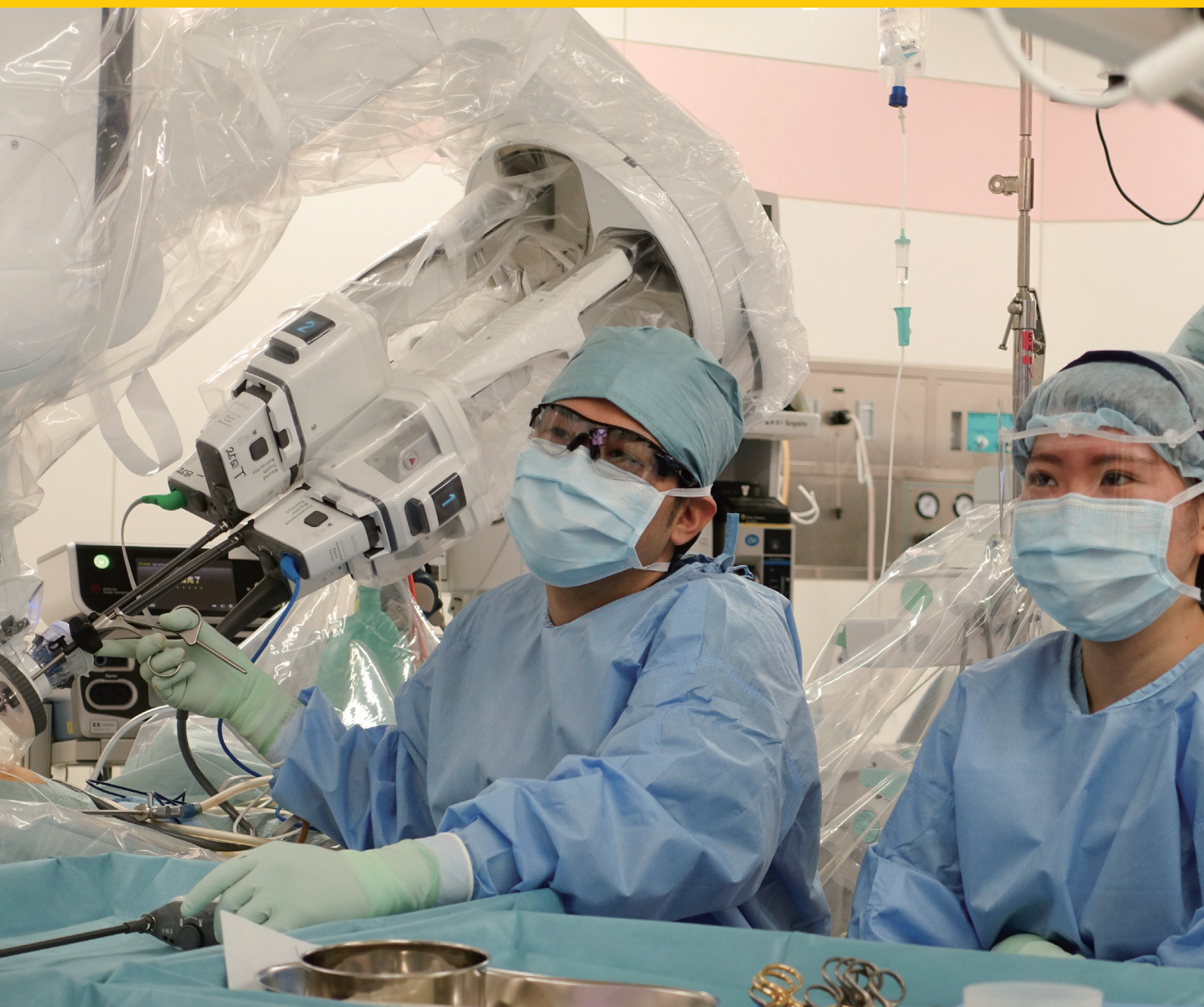
ダビンチ SP サージカルシステムによる手術風景