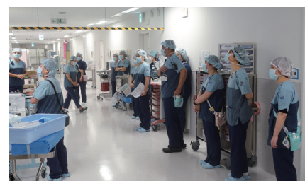
看護師ミーティング

と今回導入したダビンチ SP の計2台の手術支援ロボットが稼働、積極的に手術を行っています。最新の医療技術を駆使し、地域の皆様により良い医療を提供できるよう努めてまいります。