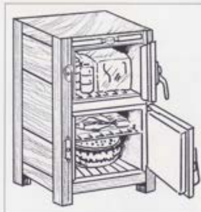
1898 江戸 1912 明治 1926 大正 1989 昭和 平成

氷冷蔵庫は、明治の終わり頃出現したようですが、三種の神器の1つ電気冷蔵庫が産まれた昭和40年頃まで、全国で使われていました。今問われている、省エネの典型的な製品でした。