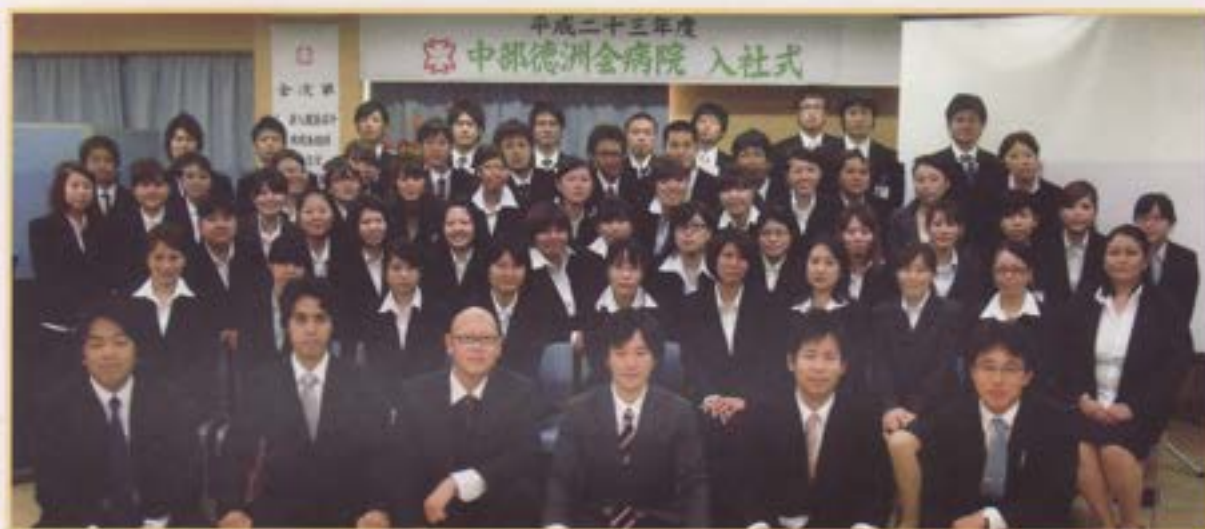
平成23年度 新入職員です。 よろしくお願ひします。