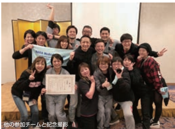
他の参加チームと記念撮影