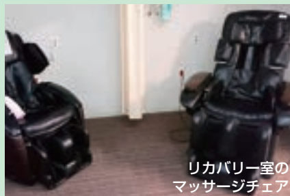
リハビリ室の マッサージチェア