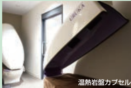
温熱岩盤カプセル