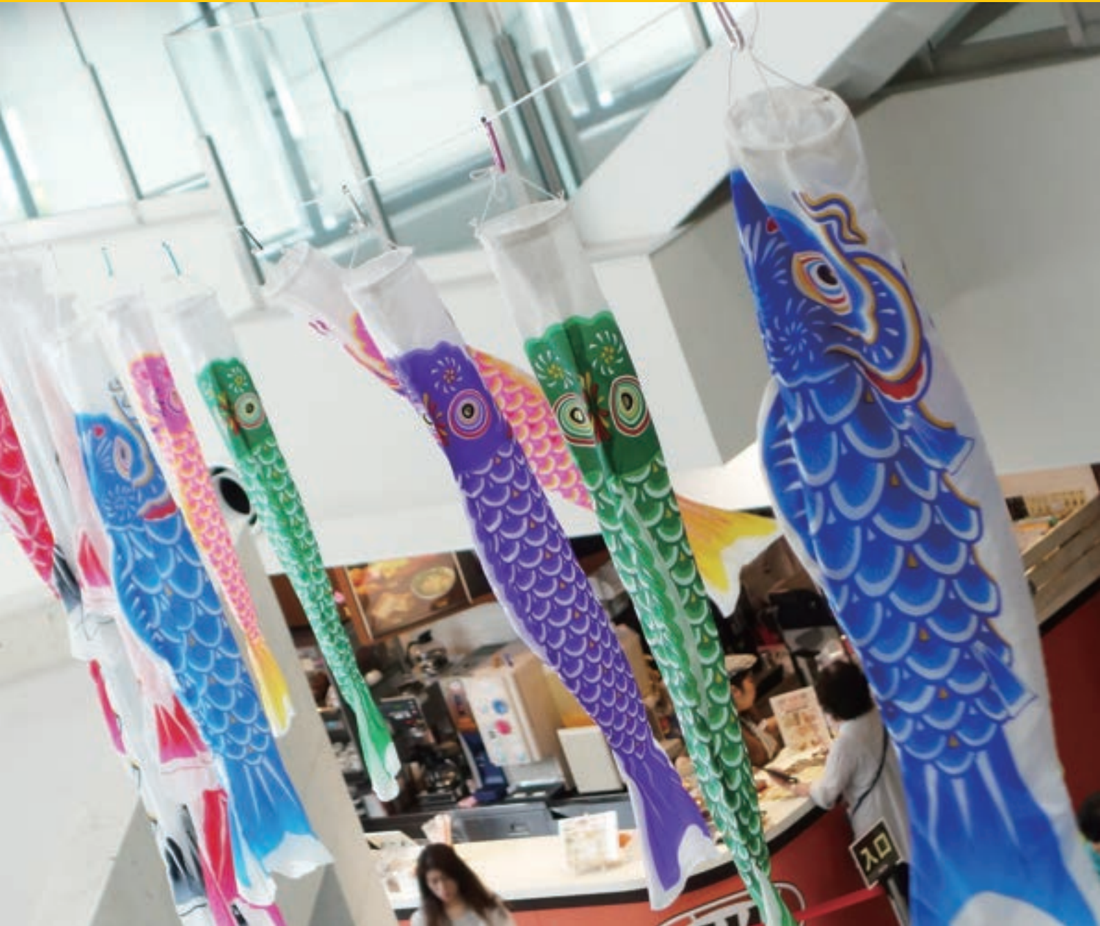
ロビーの鯉のぼり飾り

中部徳洲会病院 ☎ (098) 932-1110 ソフィアクリニック ☎ (098) 923-2110 徳洲会ハンビークリニック ☎ (098) 926-3000 与勝あやはしクリニック ☎ (098) 983-0055 よみたんクリニック ☎ (098) 958-5775 徳洲会新都心クリニック ☎ (098) 860-0755 おきなわ徳洲苑 ☎ (098) 931-1215 グループホーム美ら徳 ☎ (098) 931-1223 徳洲会伊良部島診療所 ☎ (0980) 78-6661 宮古島徳洲会病院 ☎ (0980) 73-1100 石垣島徳洲会病院 ☎ (0980) 88-0123 北谷病院 ☎ (098) 936-5611