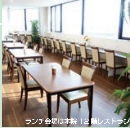
ランチ会場は本院 12 階レストラン