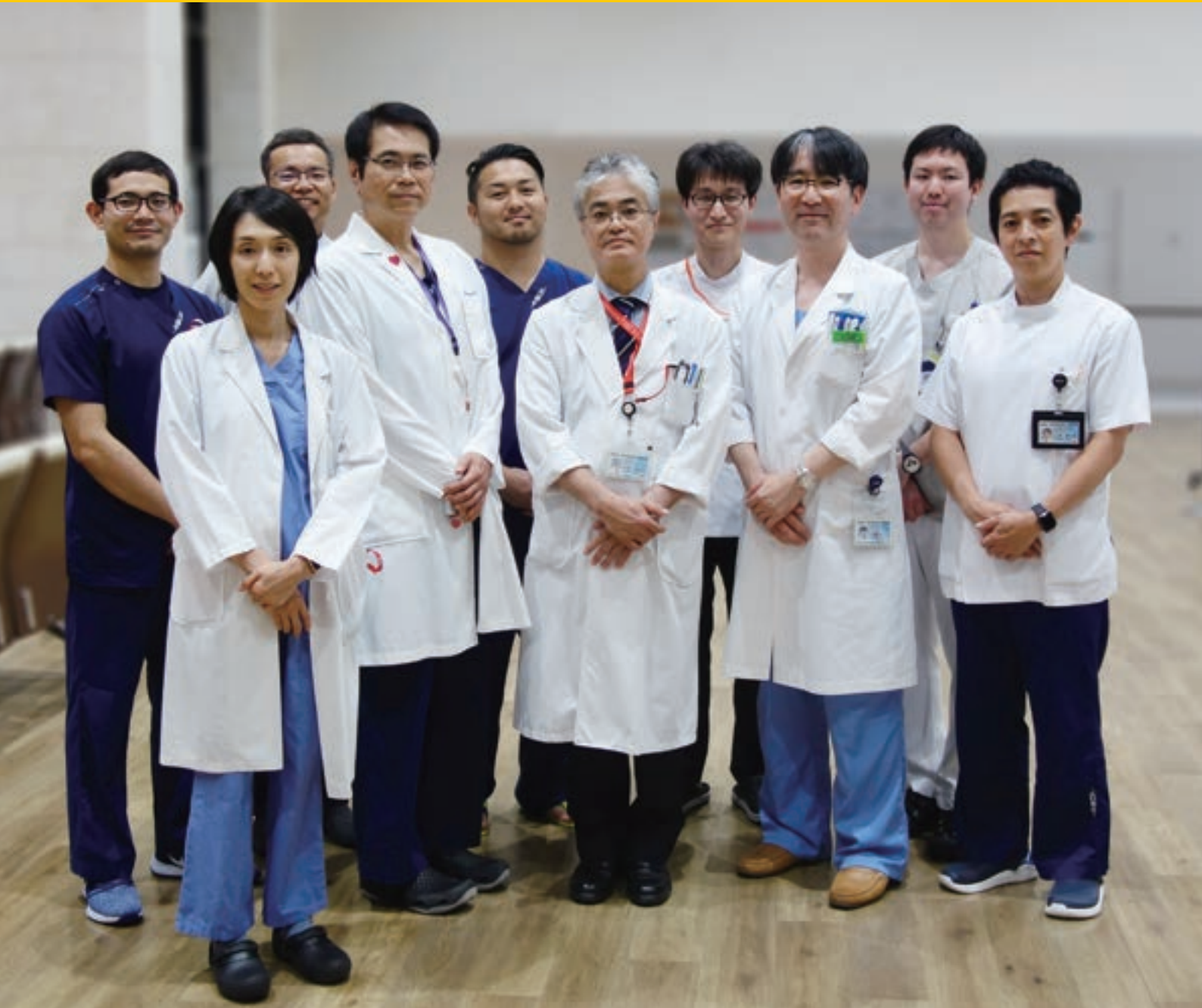
ハートチームのドクター

中部徳洲会病院 ☎ (098) 932-1110 ソフィアクリニック ☎ (098) 923-2110 徳洲会ハンビークリニック ☎ (098) 926-3000 与勝あやはしクリニック ☎ (098) 983-0055 よみたんクリニック ☎ (098) 958-5775 徳洲会新都心クリニック ☎ (098) 860-0755 おきなわ徳洲苑 ☎ (098) 931-1215 グループホーム美ら徳 ☎ (098) 931-1223 徳洲会伊良部島診療所 ☎ (0980) 78-6661 宮古島徳洲会病院 ☎ (0980) 73-1100 石垣島徳洲会病院 ☎ (0980) 88-0123 北谷病院 ☎ (098) 936-5611