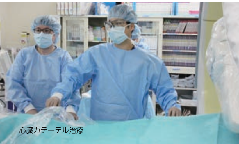
心臓カテーテル治療

心疾患に対する治療は外科、内科領域とも飛躍的に進歩しています。我々は、心臓血管外科と循環器内科を中心にハートチームを立ち上げました。複雑化した患者病態に対してお互いに情報を共有し、意見を出し合いながら最適な治療を行う事を目的としております。最新医療の追求と地域医療への貢献を両立できるように日々努力を続けていきます。よろしく願いいたします。