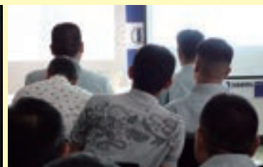
※写真は 7 月 3 日に(株)おきさん様にて行われた出張健康講座の様子