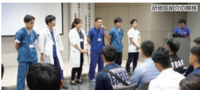
研修医紹介の様様