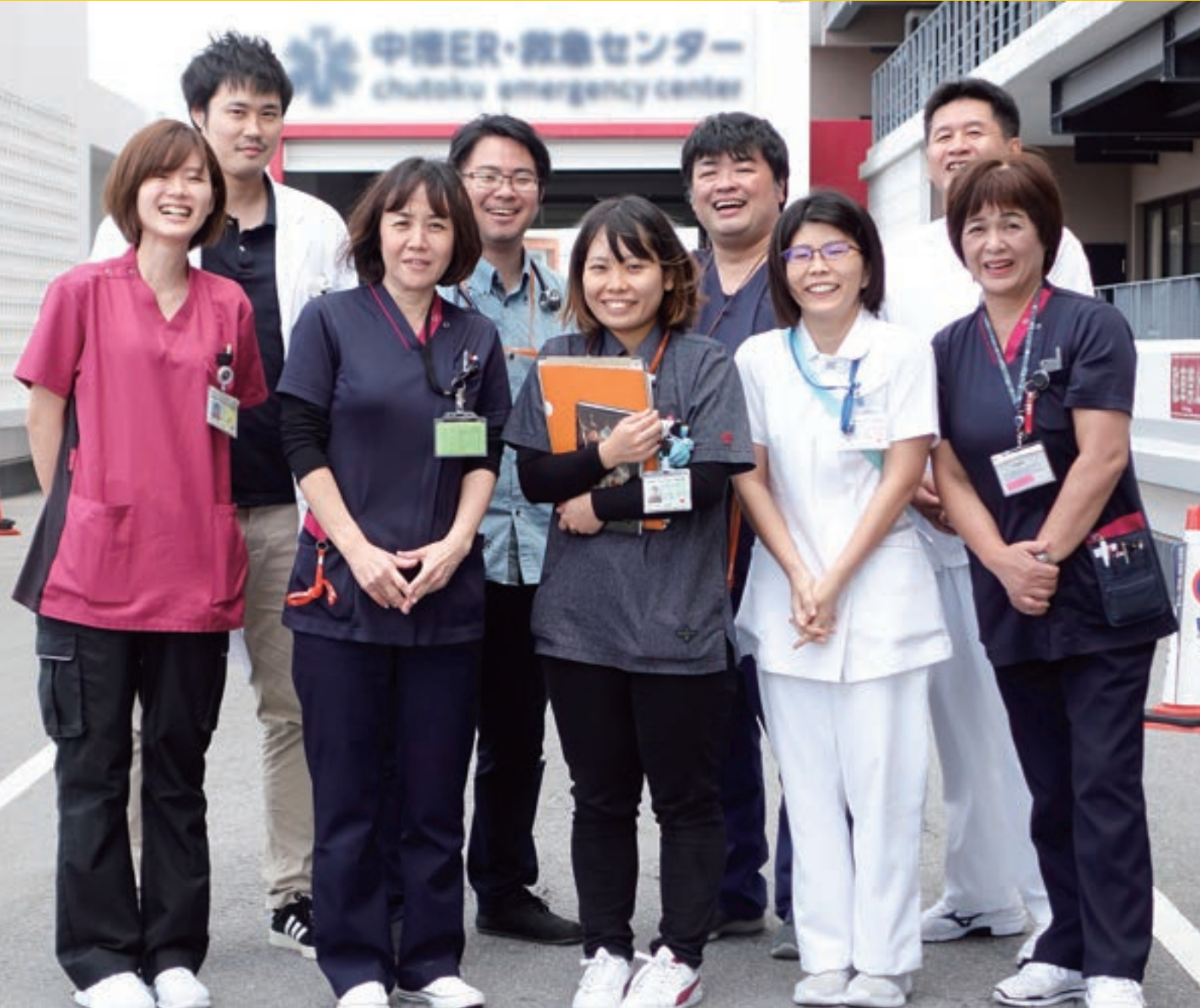
緩和ケアチームスタッフ

中部徳洲会病院 ☎ (098) 932-1110 ソフィアクリニック ☎ (098) 923-2110 徳洲会ハンビークリニック ☎ (098) 926-3000 与勝あやはしクリニック ☎ (098) 983-0055 よみたんクリニック ☎ (098) 958-5775 徳洲会新都心クリニック ☎ (098) 860-0755 おきなわ徳洲苑 ☎ (098) 931-1215 グループホーム美ら徳 ☎ (098) 931-1223 徳洲会伊良部島診療所 ☎ (0980) 78-6661 宮古島徳洲会病院 ☎ (0980) 73-1100 石垣島徳洲会病院 ☎ (0980) 88-0123 北谷病院 ☎ (098) 936-5611 ちゅうとく訪問看護ステーション ☎ (098) 939-9766 ちゅうとく居宅介護支援事業所 ☎ (098) 939-9768