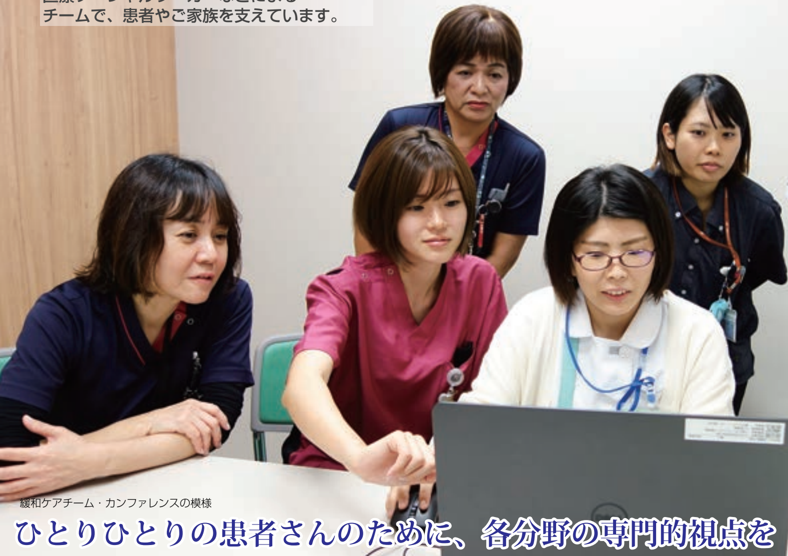
緩和ケアチーム・カンファレンスの模様

医師、看護師、理学・作業療法士、薬剤師、医療ソーシャルワーカーなどによるチームで、患者やご家族を支えています。