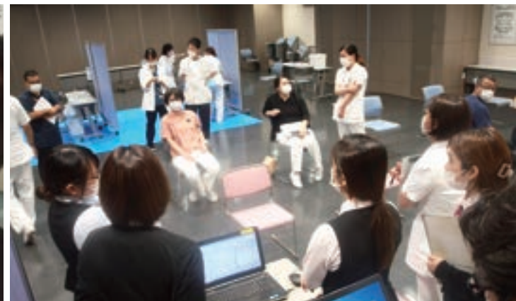
院内に設けられたワクチン接種会場の様子