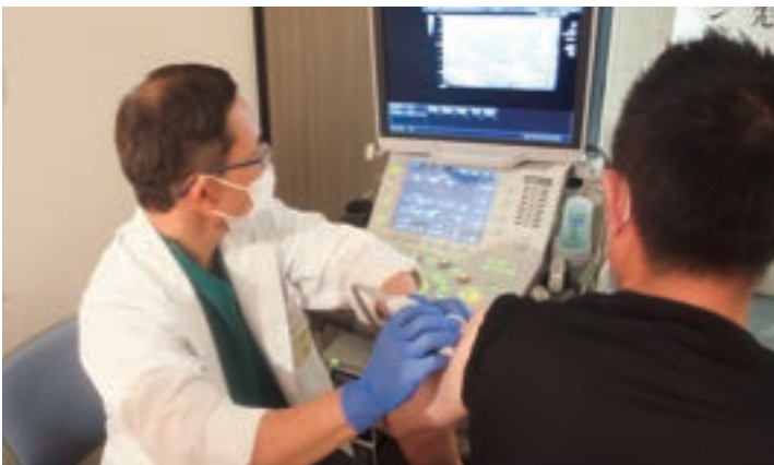
エコー検査で皮下組織が1センチ以内の場所にマーク