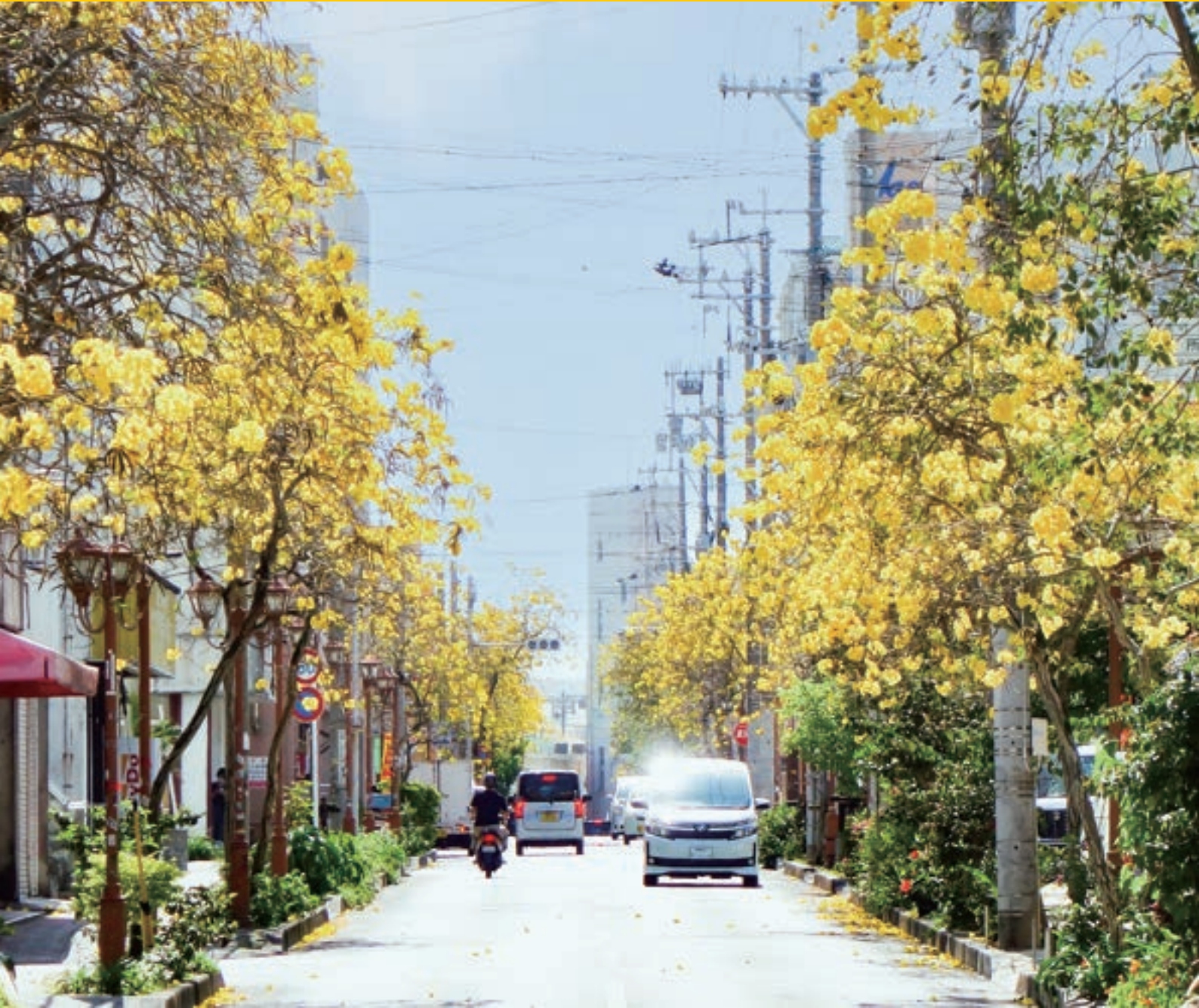
沖縄市 保健所通りにて

中部徳洲会病院 ☎ (098) 932-1110 ソフィアクリニック ☎ (098) 923-2110 徳洲会ハンビークリニック ☎ (098) 926-3000 与勝あやはしクリニック ☎ (098) 983-0055 よみたんクリニック ☎ (098) 958-5775 徳洲会新都心クリニック ☎ (098) 860-0755 おきなわ徳洲苑 ☎ (098) 931-1215 グループホーム美ら徳 ☎ (098) 931-1223 徳洲会伊良部島診療所 ☎ (0980) 78-6661 宮古島徳洲会病院 ☎ (0980) 73-1100 石垣島徳洲会病院 ☎ (0980) 88-0123 北谷病院 ☎ (098) 936-5611 ちゅうとく訪問看護ステーション ☎ (098) 939-9766 ちゅうとく居宅介護支援事業所 ☎ (098) 939-9768