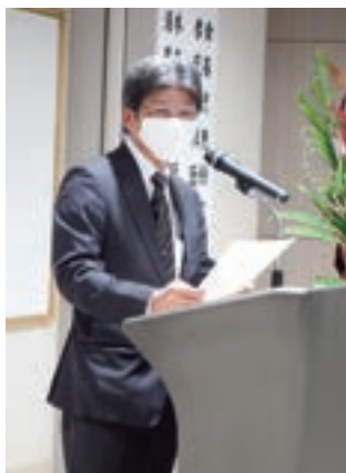
伊波 潔 総長