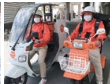
ツボデリ沖縄 (有) ツーボックス) 様