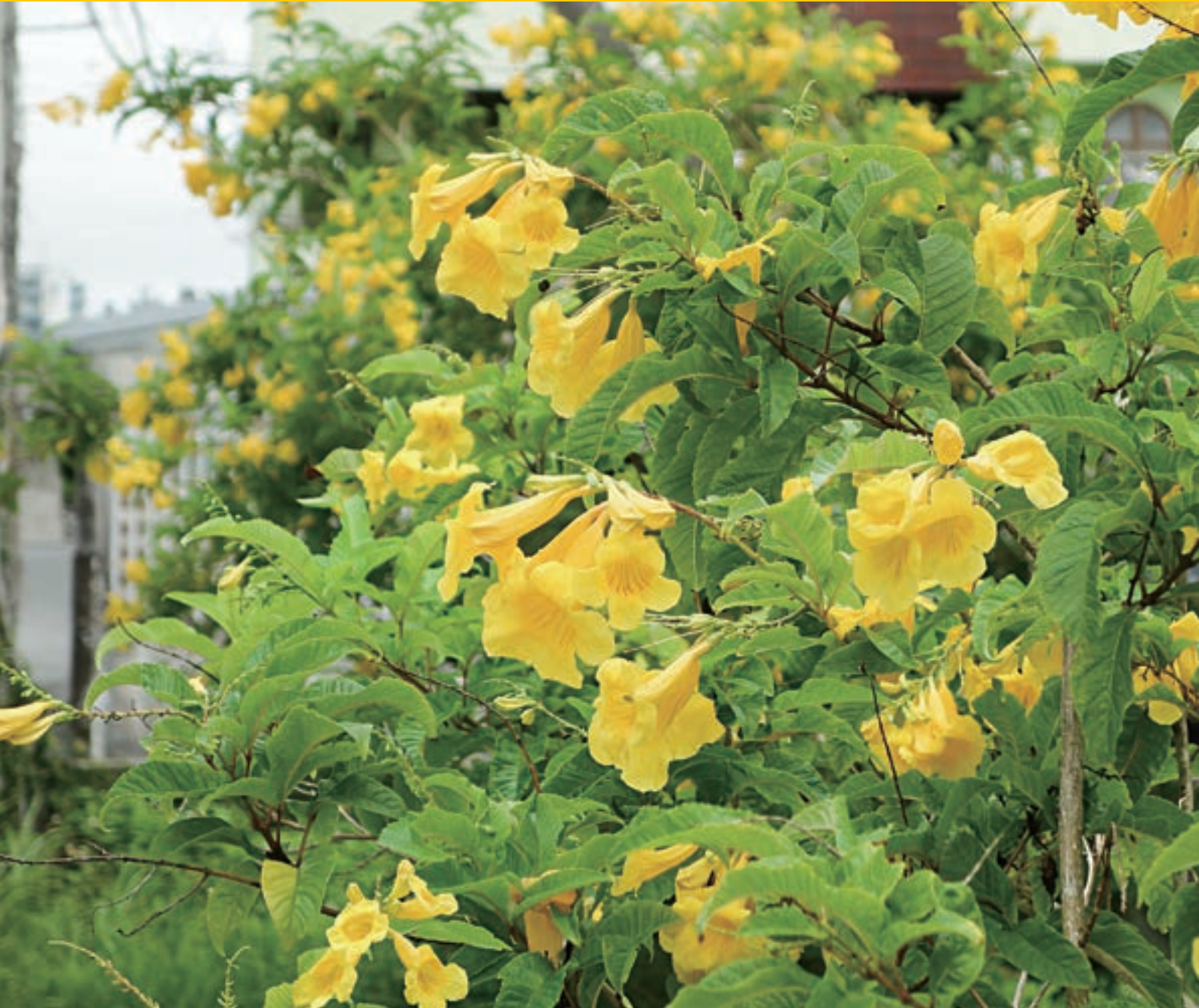
満開のアラマンダ 北中城村熱田にて撮影

中部徳洲会病院 ☎ (098) 932-1110 ソフィアクリニック ☎ (098) 923-2110 徳洲会ハンビークリニック ☎ (098) 926-3000 与勝あやはしクリニック ☎ (098) 983-0055 よみたんクリニック ☎ (098) 958-5775 徳洲会新都心クリニック ☎ (098) 860-0755 おきなわ徳洲苑 ☎ (098) 931-1215 グループホーム美ら徳 ☎ (098) 931-1223 徳洲会伊良部島診療所 ☎ (0980) 78-6661 宮古島徳洲会病院 ☎ (0980) 73-1100 石垣島徳洲会病院 ☎ (0980) 88-0123 北谷病院 ☎ (098) 936-5611 ちゅうとく訪問看護ステーション ☎ (098) 939-9766 ちゅうとく居宅介護支援事業所 ☎ (098) 939-9768