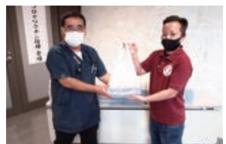
ステーキハウス 88 Jr. 美里店 様