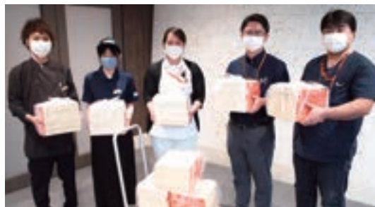
JUMBO STEAK HAN'S 松山店 様