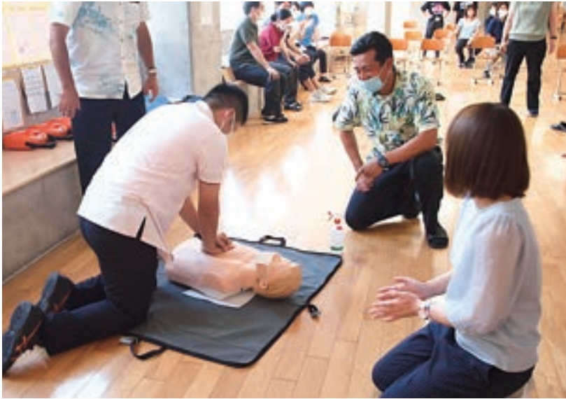
一次救命処置法～AEDを用いて

まった」「『実際目の前で倒れたら』『パニックになりながらの場合は』などリアリティある講習だった」等の評価をいただくことができました。今後も感染防止策を講じながら、実施可能な範囲で地域に貢献できるよう、講習会を実施していく所存です。