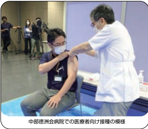
中部徳洲会病院での医療者向け接種の様様