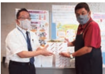
トラットリア ディ・マーレ 様