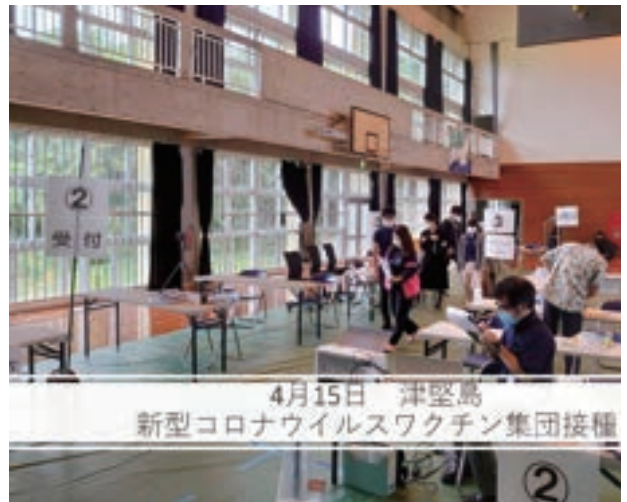
4月15日 津堅島 新型コロナウイルスワクチン集団接種

染してもウイルスを出す量が減っていることも分かっていることから、確実に流行を抑える効果が高いと考えられています。 沖縄県でも、65歳以上の方に予防接種がすすんでいます。ワクチンの集団接種については、事前に入念なシミュレーションが行われていることから、混乱なく接種が進んでいくことが期待されています。 ワクチン接種は、他の予防接種と同じく市町村が主体となり、自己負担なく全額公費