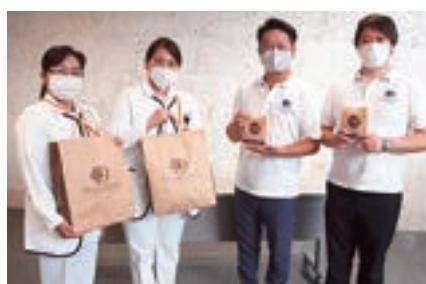
ダブルツリー by ヒルトン那覇 様