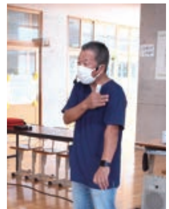
食物アレルギーとエピペンの使用方法