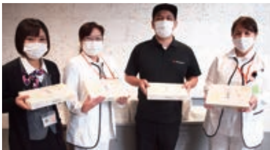
やっぱりステーキ (株)ディーズプランニング 様