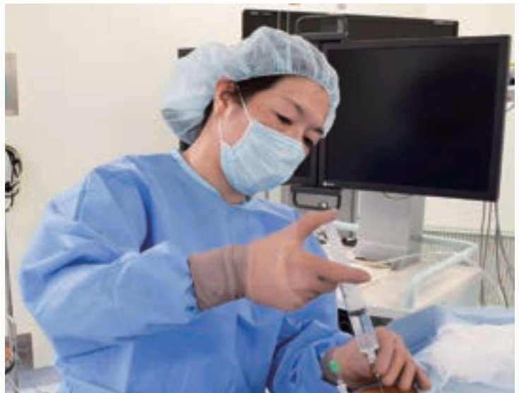
がんの痛みを緩和させる神経ブロック療法の施術

比較の結果、E-CPN群では最終的にオピオイド使用量が有意に増加しなかったのに対し、L-CPN群では増加し、腹腔神経叢ブロックが膵がんの痛みに対し、オピオイドの増量を抑制できる可能性を示しました。